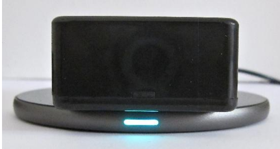
LED-Statusanzeige (blau): das RobiCare®-Geräte-Modul wird geladen.