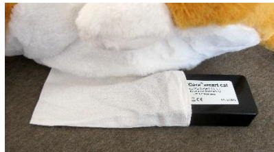
Modul in die Innentasche hineinschieben.