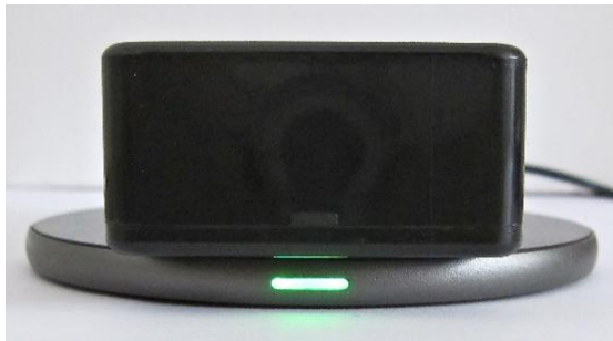
LED-Statusanzeige (grün): das RobiCare®-Geräte-Modul ist aufgeladen.