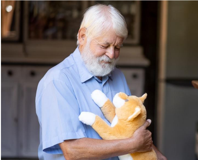
Aktivierung und Beschäftigung mit der Smart Cat von RobiCare®